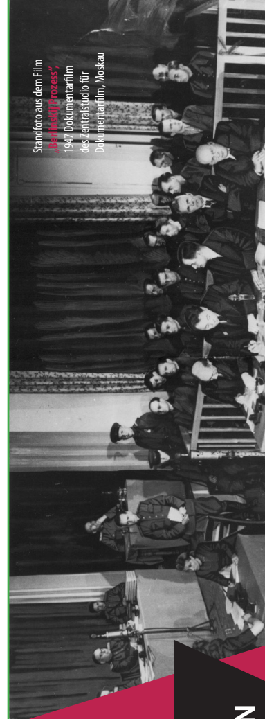
Standfoto aus dem Film „Besatzungsprozess“, 1947 Dokumentarfilm des zentralen Studios für Dokumentarfilm, Moskau

ENRICO HEITZER heitzer@gedenkstaette-sachsenhausen.de Tel: 03301-810916