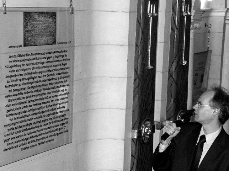
Enthüllung der Gedenktafel im Rathaus Pankow 2008, Bezirksamt Pankow von Berlin